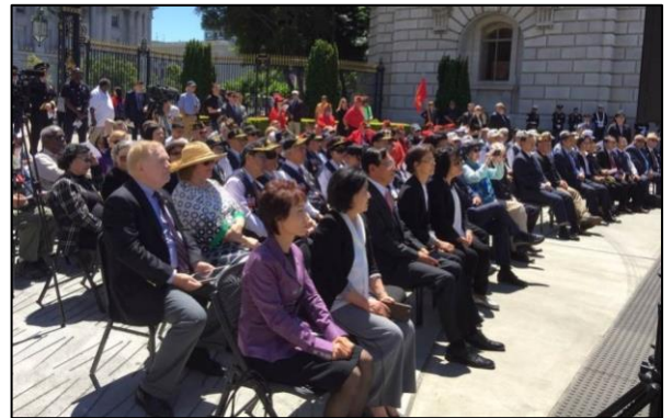
신성한 흙 헌정식에 참석한 한미 양국의 한국전 참전용사들, 한인 교민/단체장들 약 150명 참석