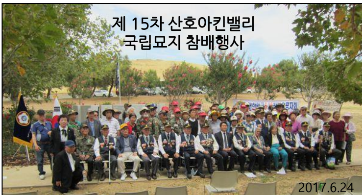
제 15차 산호아킨밸리 국립묘지 참배행사